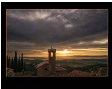
Autor: Albert Obradors