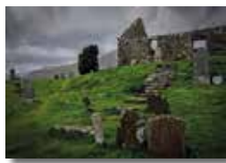
Pura Travé 4t Lliurament 19 punts