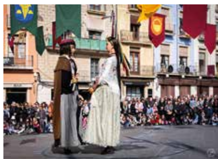
Autor: Jordi Preñanosa