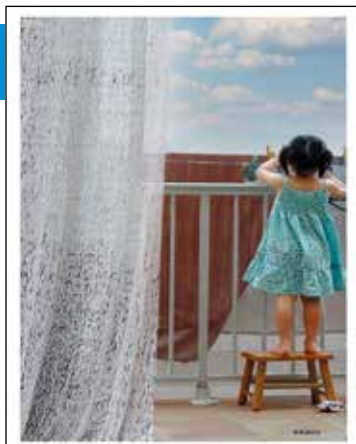
Autora: Montse Masero