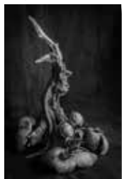
Pep Moyano 7è Lliurament 19 punts