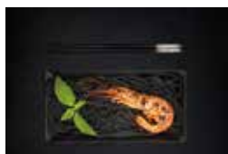
Ignasi Trape 2n Lliurament 19 punts