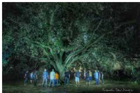
Autor: Miquel Martínez