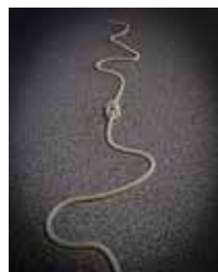
Pura Travé 2n Lliurament 18 punts