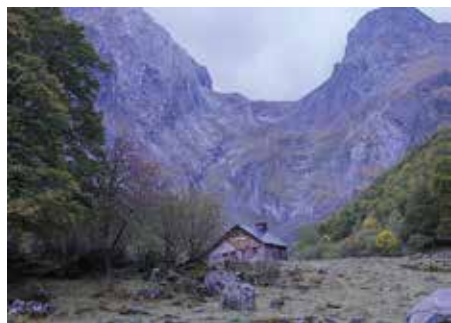
Autor: Felip Freixanet