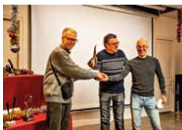
Premi Honor Pep Moyano