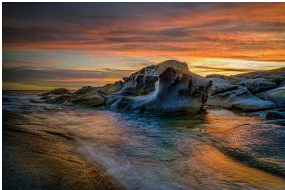
Millor fotografia social 2023