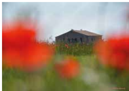
Autora: Cristina Morera