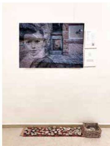
Autora: Pura Travé