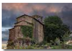
Pep Moyano 4t Lliurament 18 punts