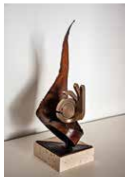
PREMI HONOR Disseny i construcció: Joan Ant. Closes