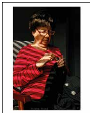
Autora: Yolanda Pradas