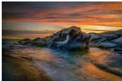
Cesc Valcarcel 1r premi