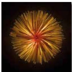
Xavi Prat 2n Lliurament 18 punts