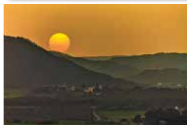
Pep Moyano 8è Lliurament 20 punts