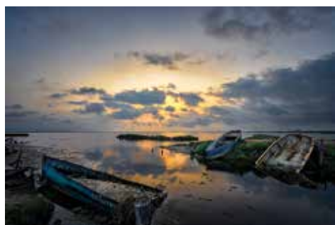
Autor: Miquel Cortadella