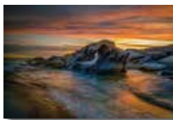
Cesc Valcarcel 8è Lliurament 18 punts