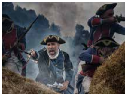
Nasi Trape 2n premi