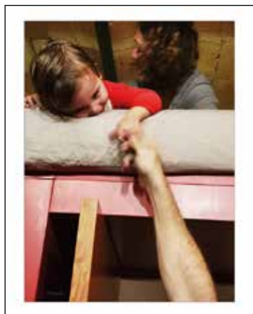
Autora: Angeles Foz