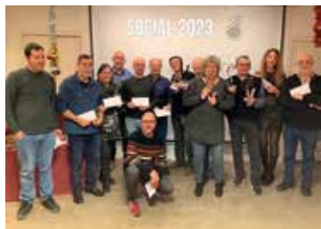
Premiats social 2023