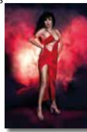
Motse Soler 5è Lliurament 18 punts