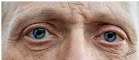
Autor: Ramon Mompó