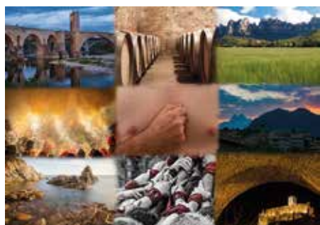
Autor: Bernat Bozzo