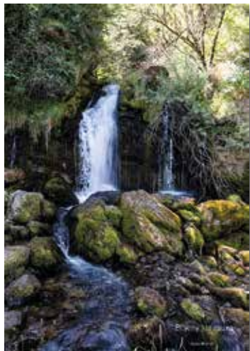
Autor: Josep Brunet