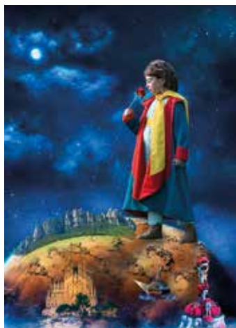
Autora: Montse Soler