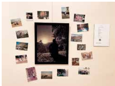
Autor: David Gracia