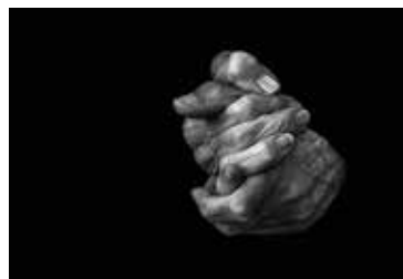
Amadeu Corrons 7è Lliurament 20 punts